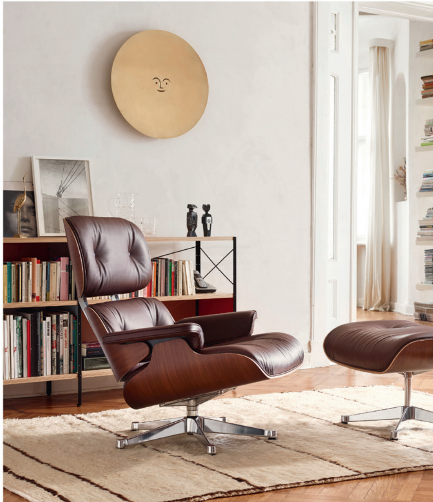
VITRA | EAMES LOUNGE CHAIR