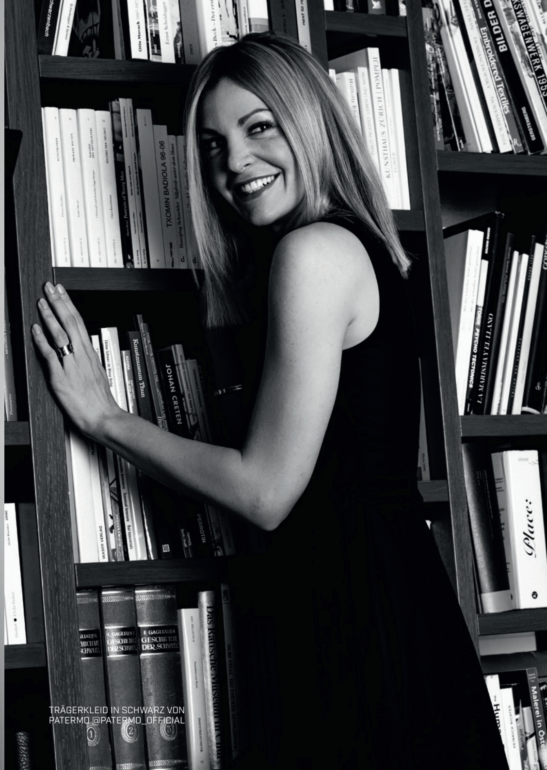
TRÄGERKLEID IN SCHWARZ VON PATERMO @PATERMO_OFFICIAL