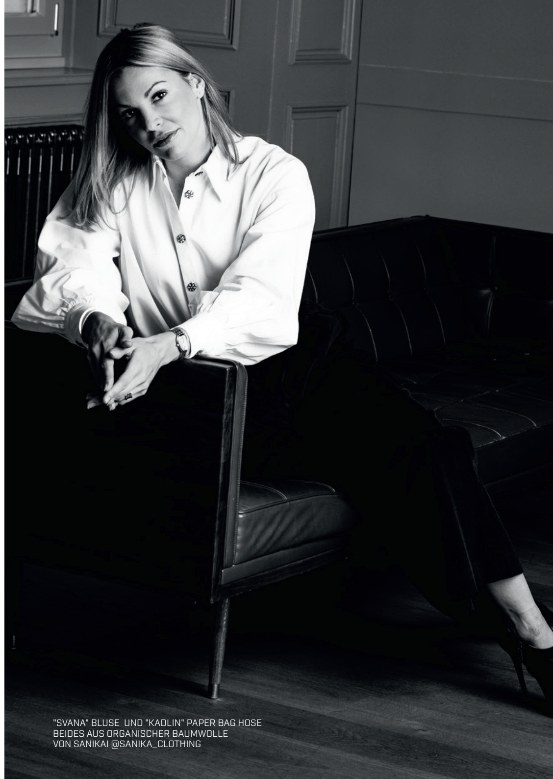
"SVANA" BLUSE UND "KADLIN" PAPER BAG HOSE BEIDES AUS ORGANISCHER BAUMWOLLE VON SANIKAI @SANIKA_CLOTHING