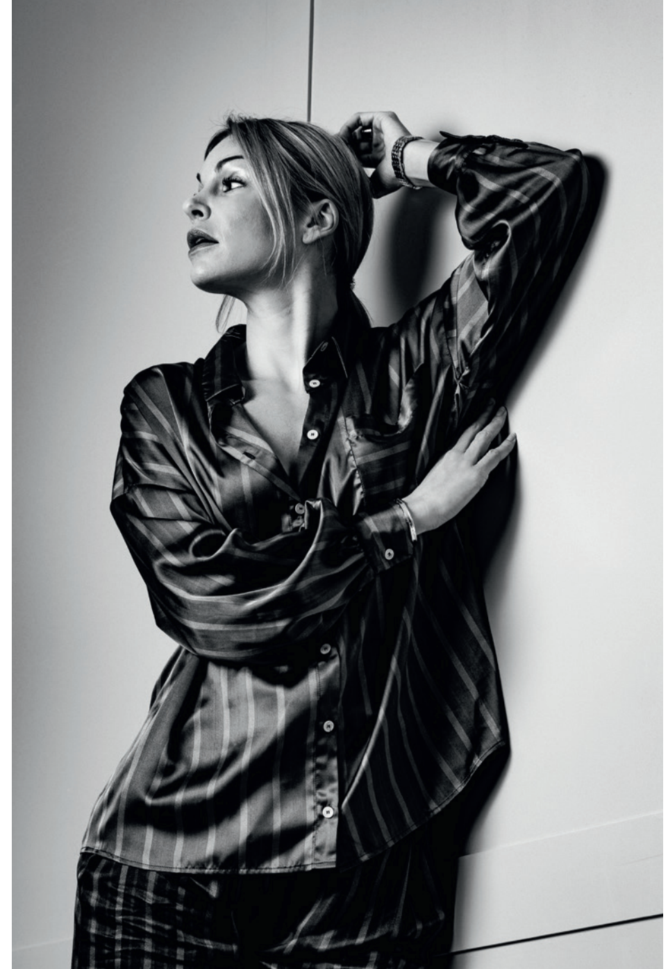
"HILDUR" BLUSE UND "JORID" WRAP HOSE BEIDES AUS RECYCELTEM PLASTIK VON SANIKAI @SANIKAI_CLOTHING

Look 1: "Svana" Bluse und "Kadlin" Paper Bag Hose beides aus organischer Baumwolle von Sanikai @sanikai_clothing Look 2: "Hildur" Bluse und "Jorid" Wrap Hose beides aus recyceltem Plastik von Sanikai @sanikai_clothing Look 3: Trägerkleid in Schwarz von Patermo @patermo_official Look 4: Schwarzes Kleid "Amalia" von Patermo @patermo_official Look 5: "Meghan" Suit in Schwarz von The Vierge @the_vierge Look 6: "Bianca" Suit in Weiss von The Vierge @the_vierge Look 7: "Clarisse" Sweater und "Candice" Hose beides aus organischer Baumwolle und Leinen von Sanikai @sanikai_clothing Look 8: "Adaliz" Kimono Dress aus organischer Baumwolle von Sanikai @sanikai_clothing