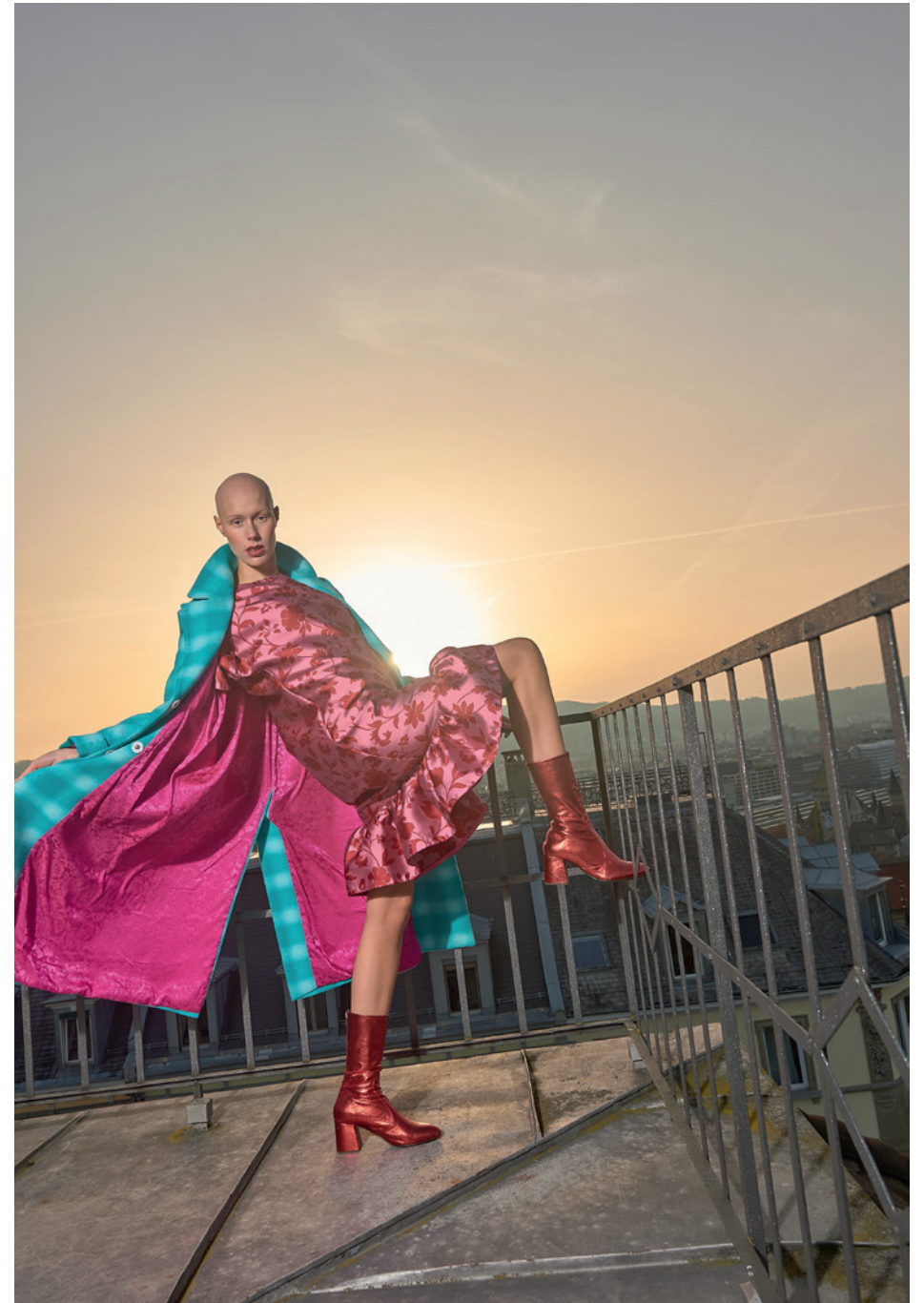
KARIERTER MANTEL IN HELLBLAU KLEID MIT BLUMENDESIGN IN ROSA UND PINK