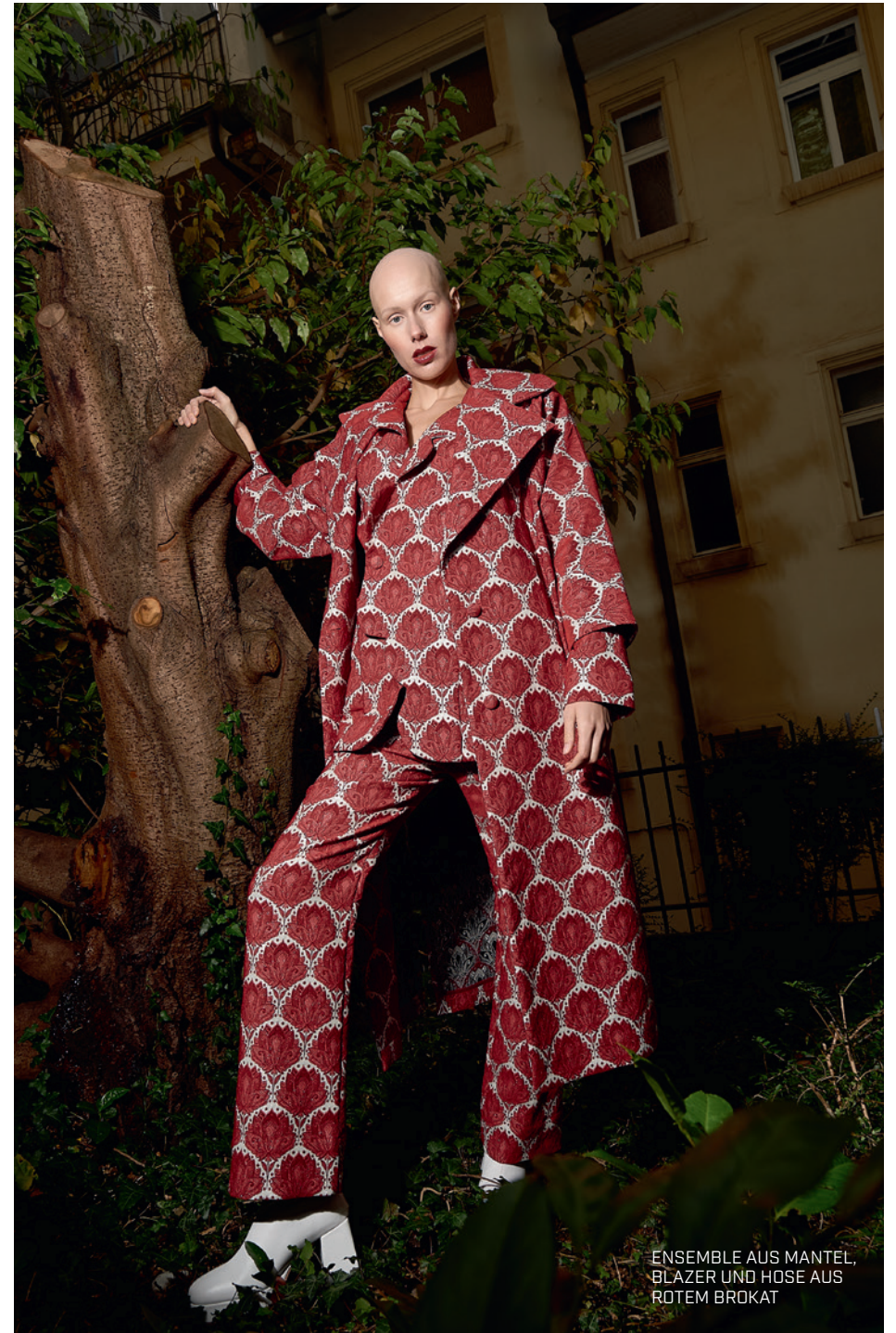
ENSEMBLE AUS MANTEL, BLAZER UND HOSE AUS ROTEM BROKAT