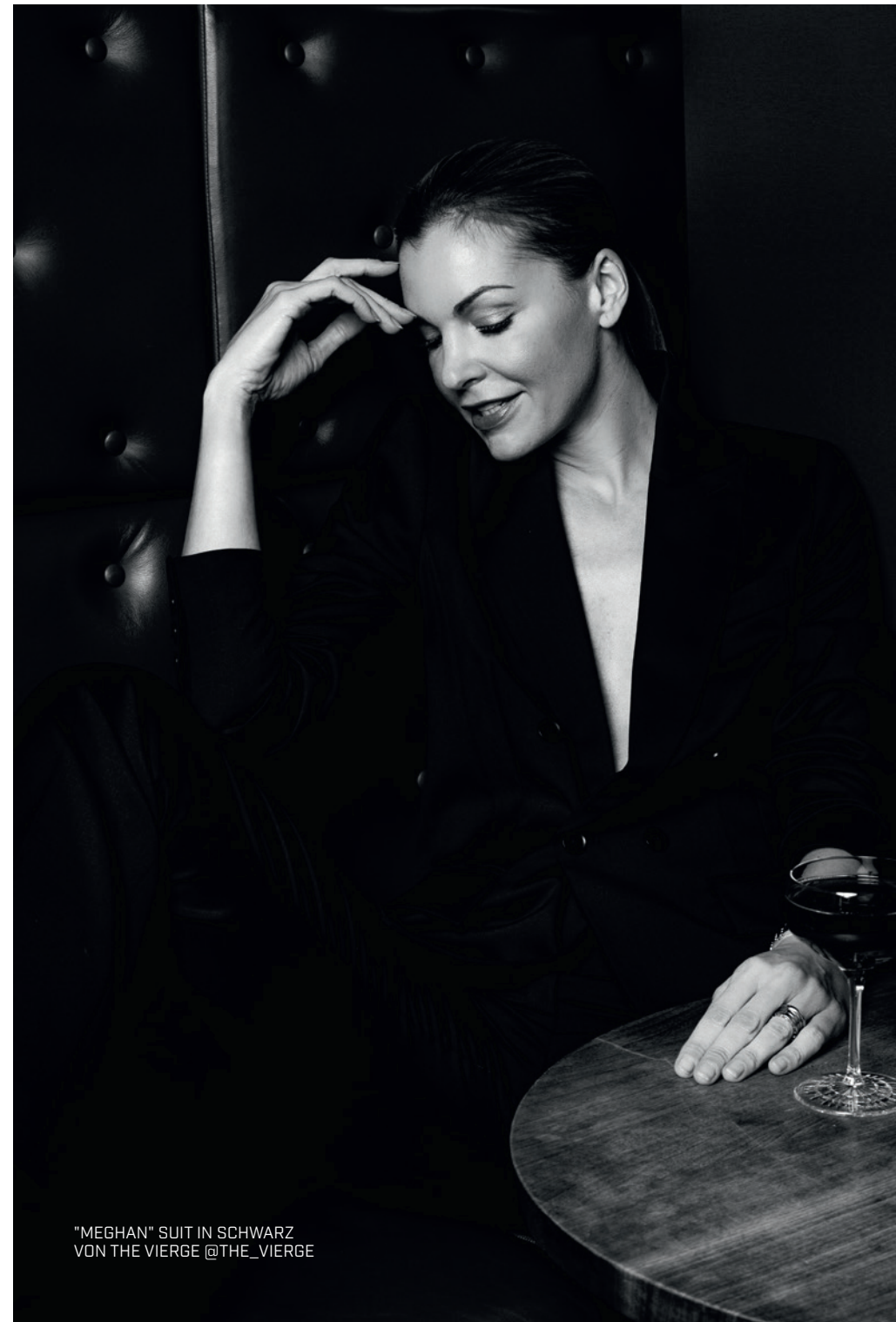
"MEGHAN" SUIT IN SCHWARZ VON THE VIERGE @THE_VIERGE